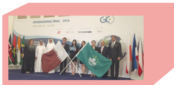
▲ 澳科大学生勇夺「2016年度世界管理挑战赛——多哈国际总决赛」全球总冠军。