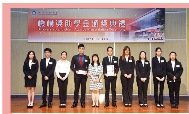
▲ 除入学奖助学金外，优秀学生亦有机会获颁机构奖助学金

成绩优秀的申请人，将有机会获颁发澳门科技大学基金会全额或半额奖 / 助学金。此外，申请人入读后如成绩优秀，还有机会获取机构奖学金。