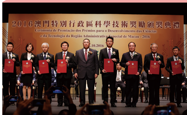
▲ 澳门科技大学研究团队于 2016 年澳门特别行政区科学技术奖励中，囊括了该次评奖中仅有的 2 个自然科学奖一等奖。